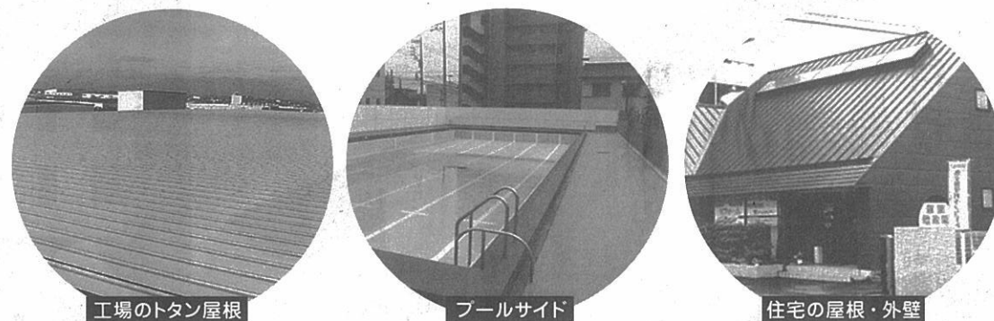
工場のトタン屋根